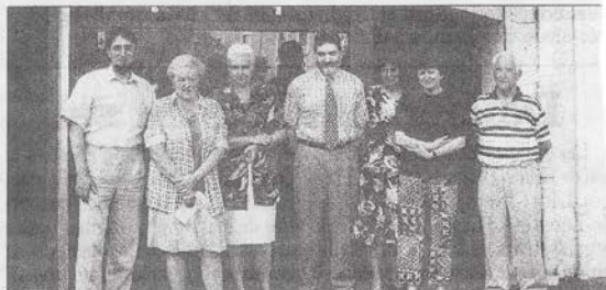
L'équipe de bénévoles d'Emploi-service veut mieux faire connaître le service aux particuliers

L'association va refaire une plaquette d'information afin de mieux se faire connaître