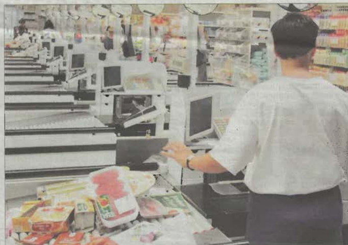
En 2013, Emploi service a proposé 61 314 heures de travail à 260 personnes. ILLUSTRATION JEAN-DANIEL CHOPIN

Les autres indicateurs économiques ne sont guère meilleurs, même si l'on compte « 77 sorties dynamiques », des bénéficiaires qui ont retrouvé un contrat ou créé une entreprise. L'activité est assurée à 65 % par les particuliers, les commandes des collectivités et des as-