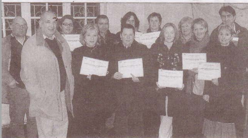
Les nouveaux diplômés d'Emploi service.

L'association oloronaise « Emploi Service » a organisé, en partenariat avec l'Union départementale des sapeurs-pompiers, une formation aux premiers secours pour ses salariés.