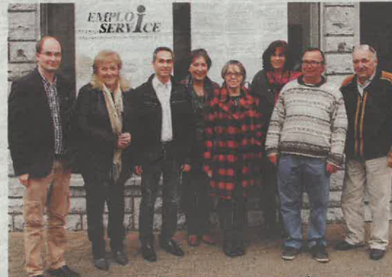
L'équipe d'Emploi Service devant la nouvelle permanence de Mauléon.