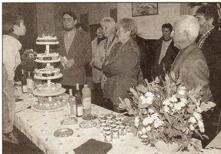
Cinq années d'existence. Avec la satisfaction d'œuvrer utilement dans le domaine de l'emploi pour les 1.650 demandeurs inscrits depuis la création de l'association.

Avant de souffler les bougies du gâteau d'anniversaire, le prési-