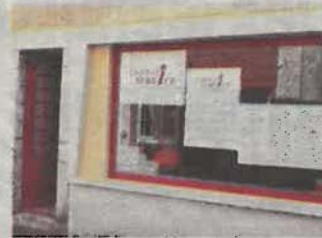
L'antenne Emploi Service d'Arudy accueille le public depuis cette semaine.

« Emploi Service existe depuis 24 ans sur le territoire du Béarn et de la Soule avec un siège social à Oloron Sainte-Marie, une antenne