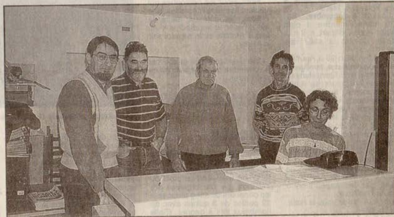
L'équipe d'Emploi-Services dans ses nouveaux locaux de la rue Centulle.