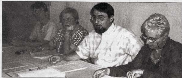
La création de l'association OMI leur permettra de continuer à faire de l'insertion

C'est donc sur le territoire sur lequel s'étend l'activité d'Emploi-Service que se déploiera la zone d'influence de « Oloron Mauléon Insertion » : celui d'origine et qui englobe le Haut-Béarn et celui qui s'est ajouté il y a peu sur les deux cantons de Soule laissés vacants par Ipeget Service. D'où l'appellation : O.M.I. pour Oloron Mauléon Insertion. Une véritable entreprise de travail temporaire, en fait,