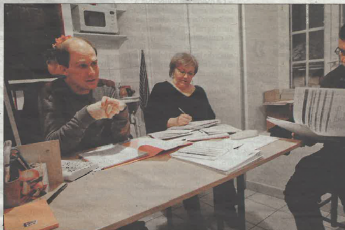
Malgré une baisse de l'activité et du chiffre d'affaires, les comptes restent sains.

Cette association intermédiaire, qui met des personnes en recherche d'emploi à disposition d'entreprises, de collectivités ou de particuliers, a « une activité en recul, à cause de la crise », expliquait son président. Le nombre de clients qui ont fait appel à elle a augmenté, le nombre de personnes inscrites aus-