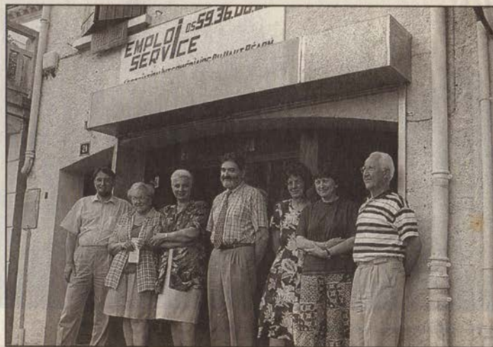
"Emploi Service" : une équipe de bénévoles, à l'écoute des demandeurs d'emploi.