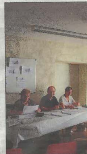
Le conseil d'administration d'Emploi-service.