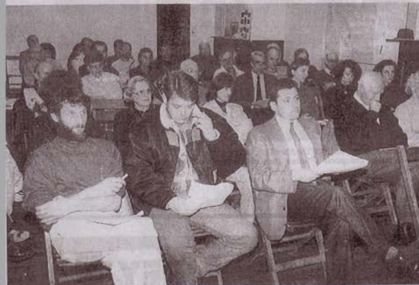
L'assistance lors de cette assemblée générale.